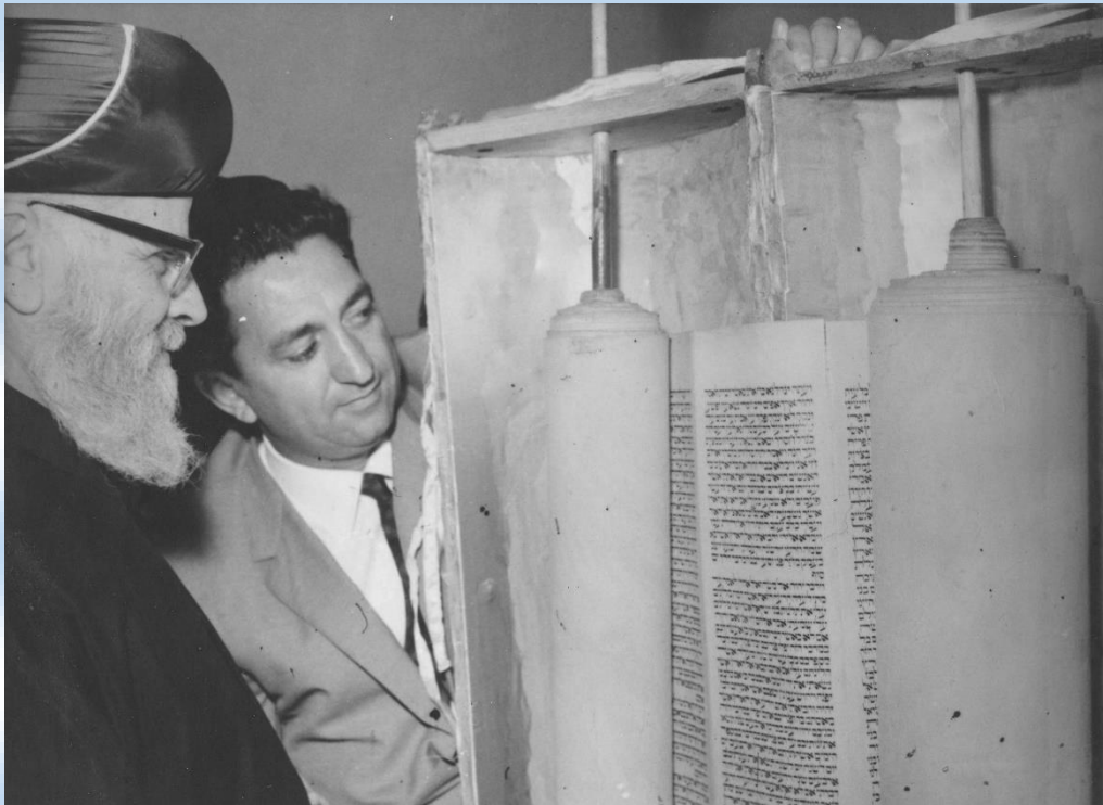
הרב נסים מעיין בעניין רב בספר תורה עתיק

הרב אהרון ליכטנשטיין, בתוך: הרב יהודה שביב (עורך), חזון למועד, עמ' 421-423