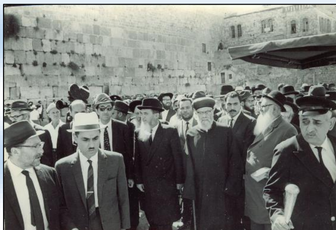
הרב נסים מבקר בכותל המערבי